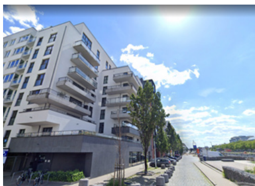
Bruxelles - Belgique