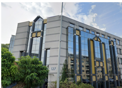
Evere - Belgique